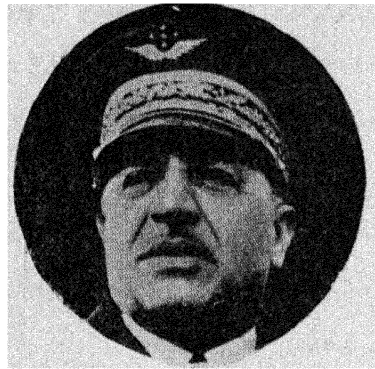
ژنرال (ویمان) فرمانده نیروی هوایی فرانسه